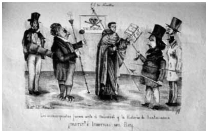
Imagen 1. “Los monarquistas juran ante El Universal y la Historia de Santa-anna ¡morir! o traernos un Rey”, El Tío Nonilla, México, diciembre de 1850, suplemento del núm. 16.